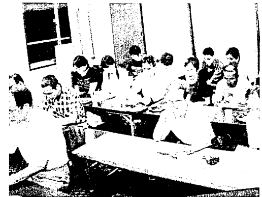
熱心に講演を聴く町内の皆さん

講演は、差別・抑圧などの行為は、人が本来持っている才能、能力、幸せになる力の発揮を妨げている。こうしたことを無くし、皆が共に、人間としてより豊かな生き方が出来るよう勉強し、努めようとの趣旨でした。講演後も熱心な質疑が行われ有意義な人権研修となりました。来年も一層、実のある研修会が開催されることを期待します。