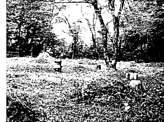
きれいになった公園内