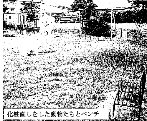
化粧直しをした動物たちとベンチ