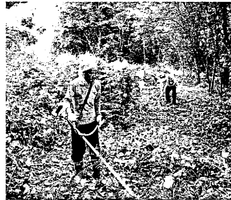
ぼうぼうと生い茂った雑草の刈り払い

このような協力の結果は、素晴らしい成果を生むことを実感し、うれしい気持ちになりました。今後も色々な事業を計画的に実施する予定です。