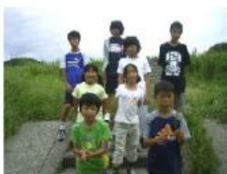
3位入賞した選手の方皆さん!