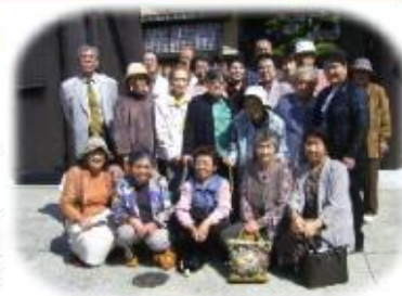
石谷家住宅の前で…!

恒例の明ろう会の研修旅行が10月9日(日)、岡山県あわくら温泉で行なわれ、楽しいひと時を過ごしました。この行事は、高齢者?の交流と親睦を図る目的で毎年開催しているもので、今年も町内の60歳以上の高齢者?25名が参加しました。前日の雨がうそのように晴れ上がり絶好の行楽日和の中、最初に訪れたのは智頭町の石谷家住宅。大庄屋として山林業を営んできたこの大邸宅、約1,400坪の広さに皆さんもびっくりしたようでした。もう一度ゆっくり尋ねてみたいと思いを残して、バスは一路、目的地のあわくら温泉「あわくら荘」へ…。予定より少し遅れましたが、到着するとさっそく食事とお風呂。和気あいあいにカラオケなどを楽しみ、懇親を深め、それぞれが楽しい思い出を胸に無事に鳥取に到着しました。