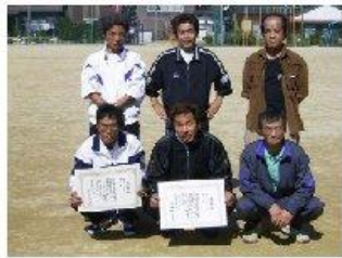
面影地区ペタンク・ソフトバレー大会で優勝した選手の皆さん

10月17日(日)に行なわれた面影地区ペタンク・ソフトバレー大会で2種目とも優勝しました。ソフトバレーは、決勝で正蓮寺チームを破っての優勝。ペタンクは、3チーム出場して、そのうちの2チームが決勝に進出するという快挙を達成しての初優勝でした。改めて「面影1丁目」の強さを印象づけた1日でした。又、11月21日に行なわれたバドミントン大会は健闘しましたが、接戦の末、大枚1区に破れ惜しくも入賞は逃しました。