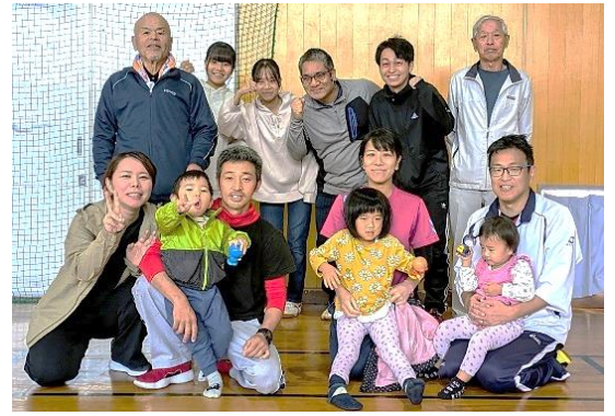
健闘した選手の皆さん